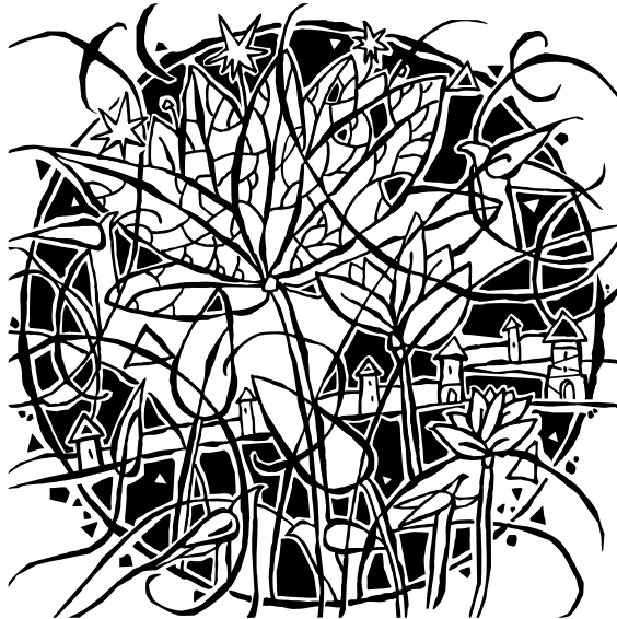
A. Matuliauskas. „Šventaragio slėnis“, 2011, šilkografija, (S/1), formatas 175 × 175 mm