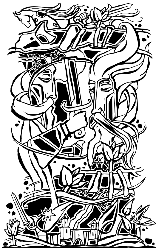
Adomas Matuliaskas. Šilkografijos darbų ciklas „Vilniaus kalnų ir piliakalnių sakmės“ „Karžygių vėlės“, šilkografija, (S/1), 2017, formatas 17 × 27 cm