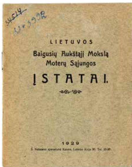
Lietuvos baigusių aukštąjį mokslą sąjungos įstatai. Kaunas, 1929. LMAVB

Organizacijos darbas vyko 2 kryptimis: tautinis ir tarptautinis. Lietuvoje, remiantis įstatais, vyko platus kultūrinis-šviečiamasis darbas, daugiausiai pasireiškęs paskaitomis, arbatėlėmis, diskusijomis, straipsniais spaudoje. Veikta tiek savarankiškai, tiek bendradarbiaujant su kitomis organizacijomis. Sąjunga vienijo įvairių profesijų moteris, nors veikloje dominavo medikės.