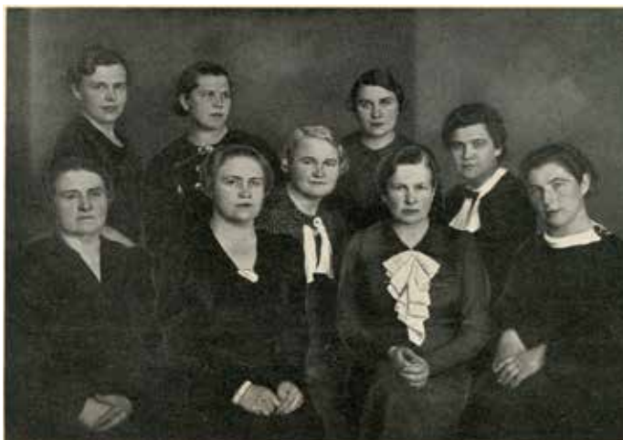
Lietuvos baigusių aukštąjį mokslą moterų sąjungos valdyba ir narių grupė. Moteris ir pasaulis , 1940, Nr. 2, p. 9. LMAVB Retų spaudinių skyrius

Vakarų Europoje, o Lietuvoje, kuri anuomet priklausė Rusijos imperijai, buvo veikiau išimtis. Tačiau vos tik atsirado galimybė moterims studijuoti aukštosiose mokyklose, lietuvės ja iškart pasinaudojo. Įprastai buvo pasirenkama praktiškiausia specialybė – medicina, garantavusi pragyvenimo šaltinį.