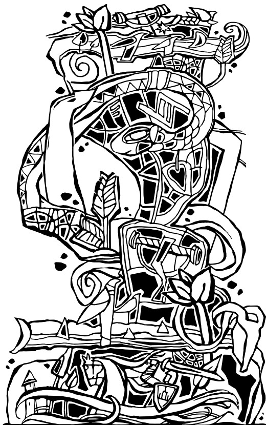
Adomas Matuliaskas. Šilkografijos darbų ciklas „Vilniaus kalnų ir piliakalnių sakmės“ „Altanos kalno sakmė“, šilkografija, (S/1), 2017, formatas 17 × 27 cm