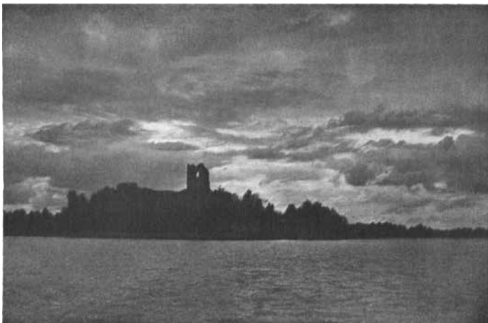
Trakai. Pilies saloje griuvėsiai.