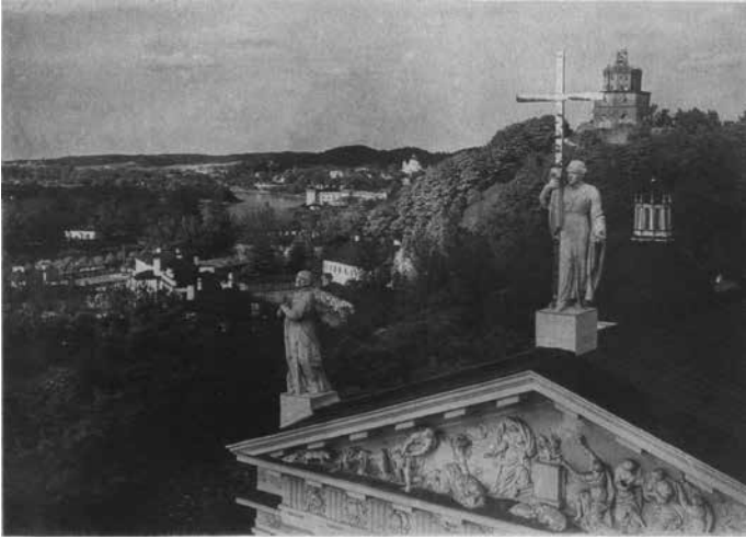
Vilnius. Katedros ir Pilies kalno vaizdas.