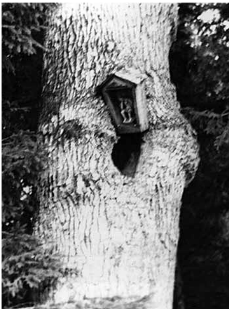
1 pav. Koplytėlė su Rūpintojėliu pritvirtinta prie medžio drevės. Šilalės raj. tarp Pajūralio ir Tenenių. Igno Končiaus nuotr. 1937 m., LMN E 21036

šių pastarųjų, tos givotos yra gerbiamos, joms nieko blogo nedaro***. Net mūsų Prūsijoje kur nekur girdėti, ypač prie Lietuvos sienos, kad šis velniškas paklydimas dar nėra iš žmonių išrautas; žinoma, jie gyvatėms nesimeldžia, bet vis dėlto duoda joms valgyti ir neleidžia skriausti nerimaudami, kad nenustiptų gyvuliai ar šiaip nebūtų kokio nuostolio ūkyje.