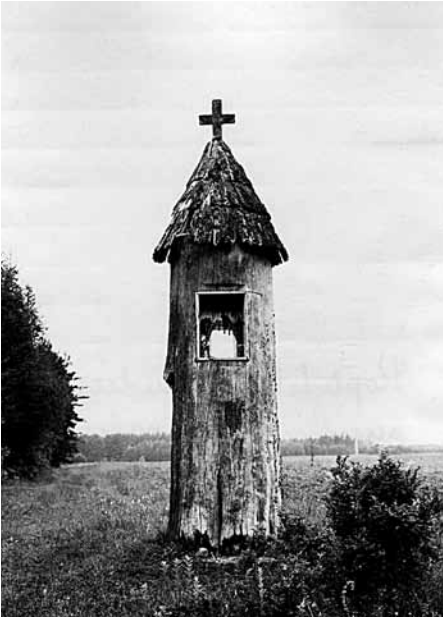
4 pav. Baublė koplytelė prie Trakų – Rūdiškių kelio. 1955 m., LNM E 24383

šiandien įvairiose vietovėse, daugiausiai vis dėlto Semboje, liudija kunigai, – savo akimis matę tokius alaus butelius ar ąsočius, iškastus iš kapų*****. Kuo sunku būtų patikėti, jei nebūtų tiek daug akivaizdžių įrodymų <...>