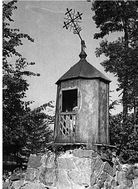
5 pav. Baublė koplytelė Kretingoje. Juozo Petrulio nuotr. 1957 m., LNM, negat. nr. 13430

** Dancigo : šiandieninis Gdanskas Lenkijoje.