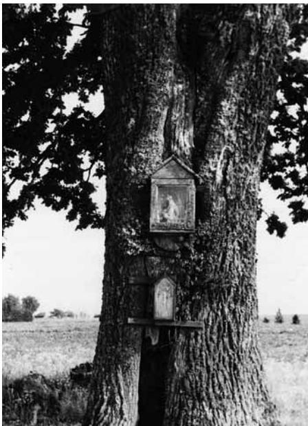
3 pav. Liepa su dreve, ant kurios angos medžio kamieno išorėje pritvirtintos dvi koplytėlės. Kelmės raj., Pavandenė, 1943 m., LNM E 21984

kaimą Semboje****, esantį prie Prėgliaus upės, aštuonios mylios nuo Karaliaučiaus. Prieš keletą metų čia patekė antikvarinių daiktų mėgėjai pastebėjo lauke prie kelio daug kruopščiai supiltų kalnelių***** ir sumojo, kad jie padaryti tikslingai, – gali būti pagoniškieji prūsų kapai. Pakvietę gretimo dvaro darbininkus liepė vieną kalvą atkasti. Nenusivylė, nes rado įvairių puodų su pelenais, pusiau sudegusiais kaulais. Tą vietą, kur jie kasinėjo, aš pats mačiau ir būčiau daugiau tokių kalvų atidengęs, jei būtų leidę anuometiniai nesiliaujantys lietūs. Visgi netoli minėto dvaro vieną kalnelį liepiau atkasti, jokių urnų ir nieko daugiau jame neradau kaip tik priešais kits kitą sustatytus du akmenis, kurie iš vidaus buvo nutašyti, taigi, aiškiai matyti, jog anksčiau tarp tų akmenų galėjo būti kažkas