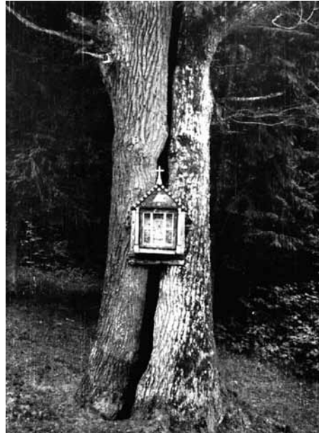
2 pav. Koplytelė prie išdubusio ąžuolo. Joje Sopulingosios Dievo Motinos skulptūrėlė. Telšių aps. miške tarp Luokės ir Pavandenės.