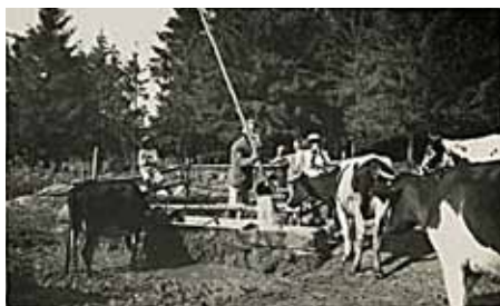
9. Galvijų girdymas Jokūbiškių kaime. Kraštotyrinė ekspedicija Jokūbiškių k., Šiaulėnų vls., Šiaulių apskr., 1938-08-30-09-08. ŠAM, EA, byla Nr. 28, l. 99.

Piemenų amžius, imant laikotarpį nuo 70 metų tam atgal, maža tėra pasikeitęs, nes čia jau nuo seniau mažesnis piemenis prižiūrėdavo senas skerdžius. Vidutiniškai imant, seniau buvo apie 12–13 metų, nors, žinoma, būdavo jaunesnių ir vyresnio amžiaus. Dabar net dar mažesni jau gano bandą. Šiuo atžvilgiu yra tokia būklė: gospodariai, turį savo paaugančių vaikų, jau leidžia vieton samdyti piemens ganyti bandą 10–11 metų vaikui. Samdant, suprantama, samdoma kiek vyresnio amžiaus piemenukas – apie 13–14 metų. Kartais pasitaikydavo ir po 16–17 metų piemenų, bet tai jau rečiau atsitikdavo. [...] Paviržius duodamas, kaip pasakoja senukas, nuo senovės tiktai natūra. Tarytum pagal kokias tradicijas visada duodama didelis kepalas duonos ir dar mėsos, pav., lašinių bent porį kilogramų (seniau apie 5 svarus), nors niekada šeiminiškė nesverdavo – atpjaudavo nuo palties savo nuožiūra ir duodavo. [...]