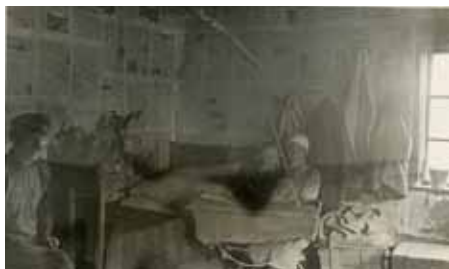
7. Antano Gedrimo sodybos gyvenamojo namo vidus. Kraštotyrinė ekspedicija Pikelių k., Vaiguvo vls., Šiaulių apskr., 1937-07. ŠAM, EA, byla Nr. 4, l. 117.