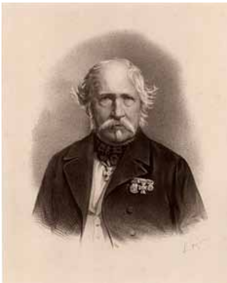
1 pav. Teodoras Narbutas. Maksimiljanas Fajansas, 1857, popierius, litografija, LDM, šifras G-2877/b.