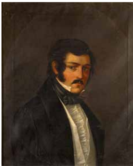
3 pav. Liudviko Narbuto portretas. Autorius nežinomas, XIX a. II p., ŠAM, D-T 447, drobė, aliejus.