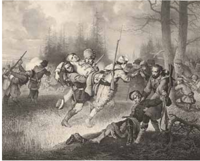
4. Liudviko Narbuto mirtis ties Dubičiais. Mykolas Elvyras Andriollis, popierius, litografija, LDM, šifras G-3752.