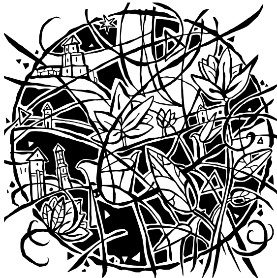
A. Matuliauskas. „Augantis miestas“, 2012, šilkografija, (S/1), formatas 175 × 175 mm