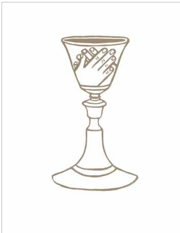
Skaistė Ašmenavičiūtė. Linoraižinių darbų ciklas „23 psalmė“, „IX. Ps 23, 5 <...> sklidina mano taurė!“, linoraižinis, 2017, 35 × 44 cm